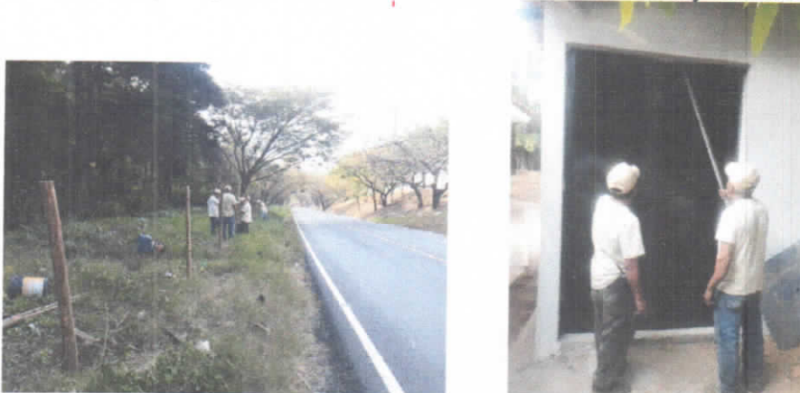
(foto 19 y 20) Ampliación de cerco perimetral y colocación de puerta de bodega.