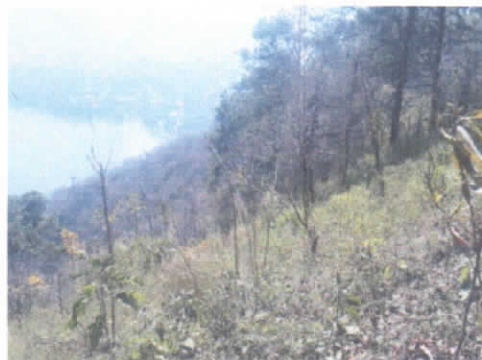
(foto 13 y 14) Áreas para el establecimiento de 2 hectáreas de establecimiento de acequias.