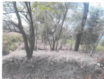
(foto 1 y 2) Brechas o líneas de control para la protección, contra incendios.