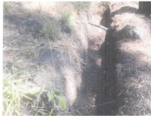
(foto 11 y 12) Estado actual de estructuras de conservación de suelos.