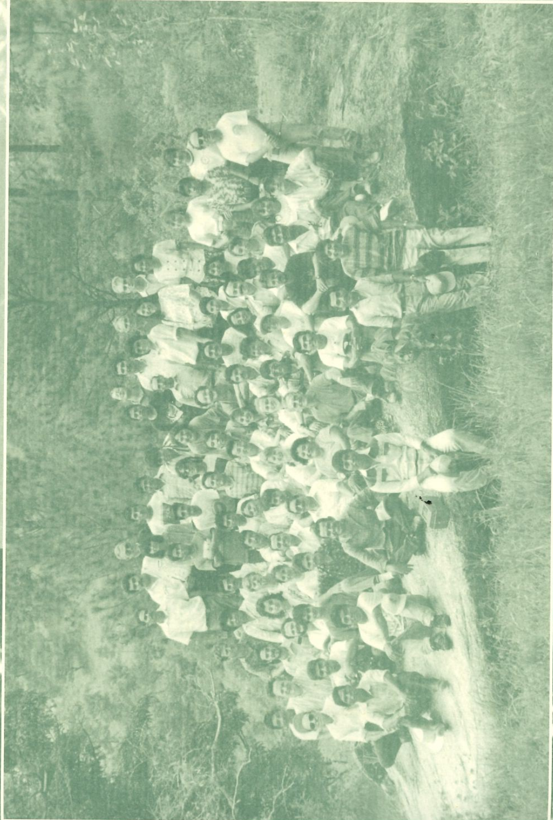
Directiva, Administración, Personal Técnico de Campo y Voluntarios.