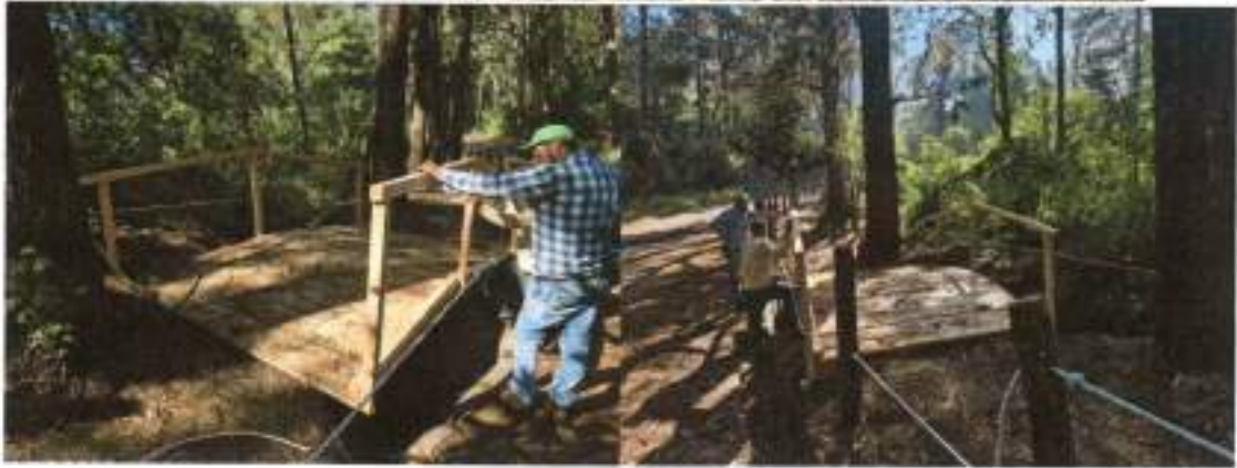
Foto 18-21: Actividades y mantenimiento realizado en el mes de diciembre.