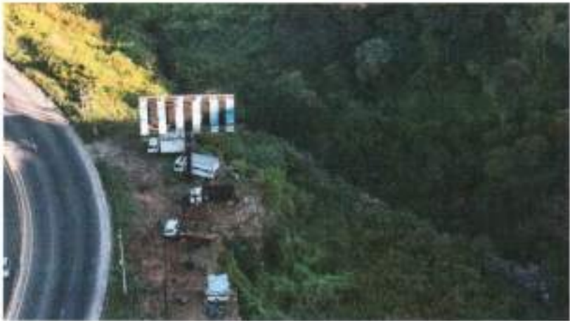
Fotos 7-9: Identificación de ilícitos por medio de dron

Se concluyó la estación de bomberos forestales, sitio donde se almacena todo el equipo de protección personal, herramientas, mangueras, agua, alimentos, etc. Estará en apresto durante la temporada.