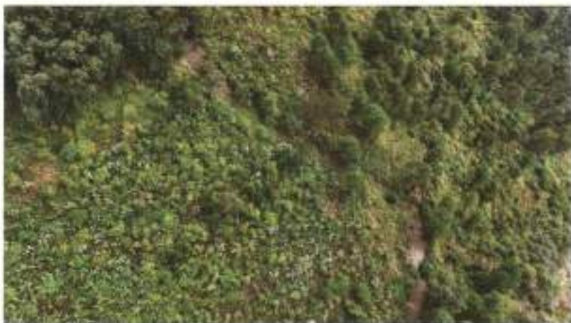
Foto 5 y 6: Vista aérea de brecha que protege zona de recuperación (área en proceso de regeneración natural).

Fotos 1-4: Trabajos de mantenimiento del sistema de brechas cortafuegos.