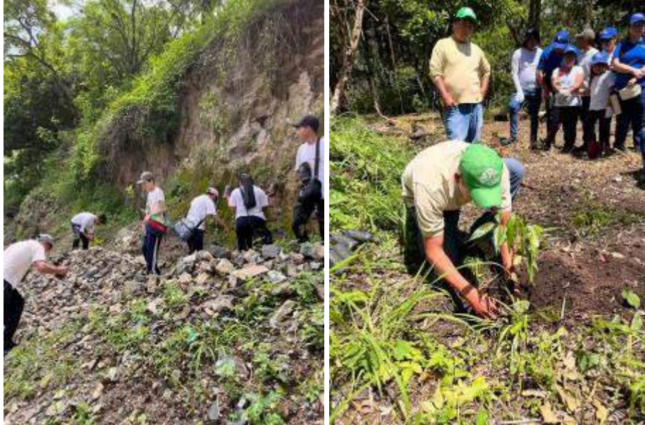
Foto 5 y 6: Personal guardarecursos reforestando y producción de plantas nativas en PNNU (fotos de julio 2024)

En julio, se establecieron las 5 hectáreas de reforestaciones en el parque, en los lugares que sufrieron incendios forestales.