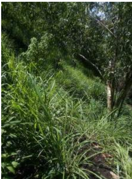
Foto 7: Área en proceso de regeneración natural (fotografía de agosto 2024).