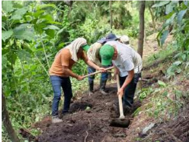
Guatemala, octubre del 2024