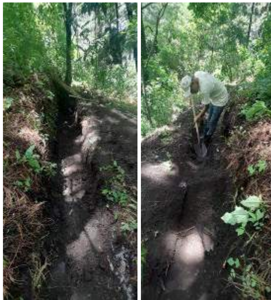
Foto 8 y 9: Estado actual de las acequias con mantenimiento (foto de junio 2024).

Ya se concluyó con el mantenimiento del sistema de estructuras de conservación de suelo y agua.