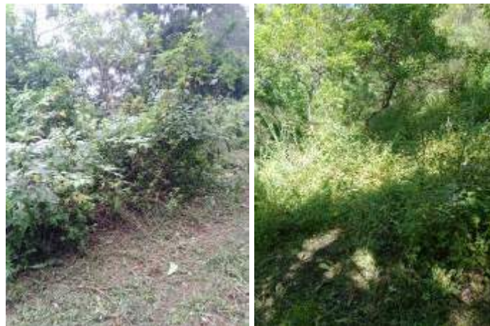
Foto 7 y 8: manejo de regeneración natural (repique o liberación de brotes) (fotografías de octubre y agosto 2023).

Este proceso iniciará en época lluviosa del 2024, priorizamos áreas degradadas por tala ilegal o por incendios forestales. Para esta actividad tenemos identificadas áreas con potencial para realizar estos trasplantes. Principalmente con especies de alto valor ecológico y bajo valor económico (maderable).