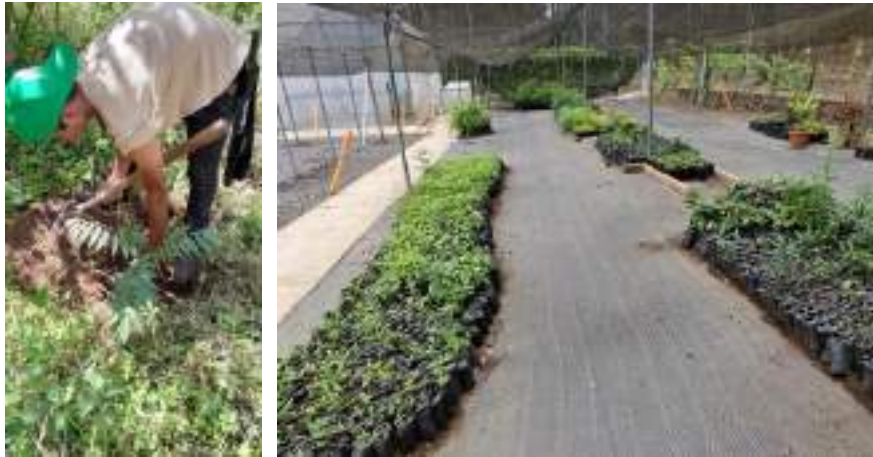
Foto 5 y 6: Personal guardarecursos reforestando y producción de plantas nativas en PNNU