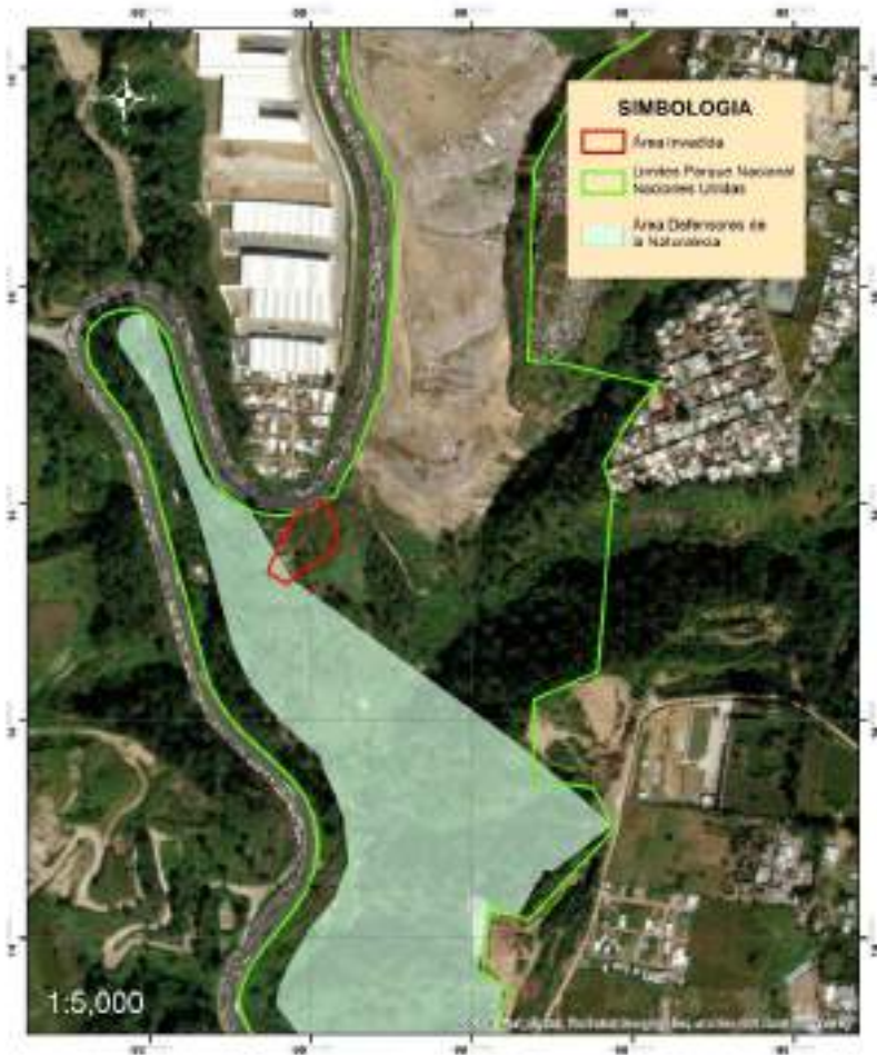
Mapa 1: Ubicación de invasión