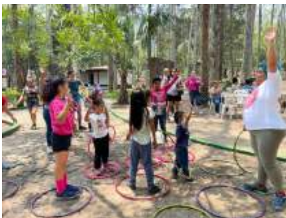
Foto 13, 14 y 15: actividades de educación ambiental descritas.