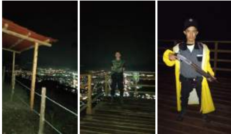
Foto 10, 11 y 12: Personal de vigilancia para prevención de incendios forestales las 24 horas del día.

5.8 Otorgar la cooperación técnica y financiera a la Fundación Defensores de la Naturaleza necesite, siempre que se encuentre dentro de sus posibilidades para el desarrollo dentro del Parque Nacional Naciones Unidas de proyectos de Conservación y Manejo de la Cuenca, considerando que el terreno de este Parque Nacional es parte importante de la Cuenca del Lago de Amatitlán, por lo que se hace necesario realizar actividades de protección y manejo de la misma, incluyendo Educación Ambiental dirigida a estudiantes y población que visita el mismo.