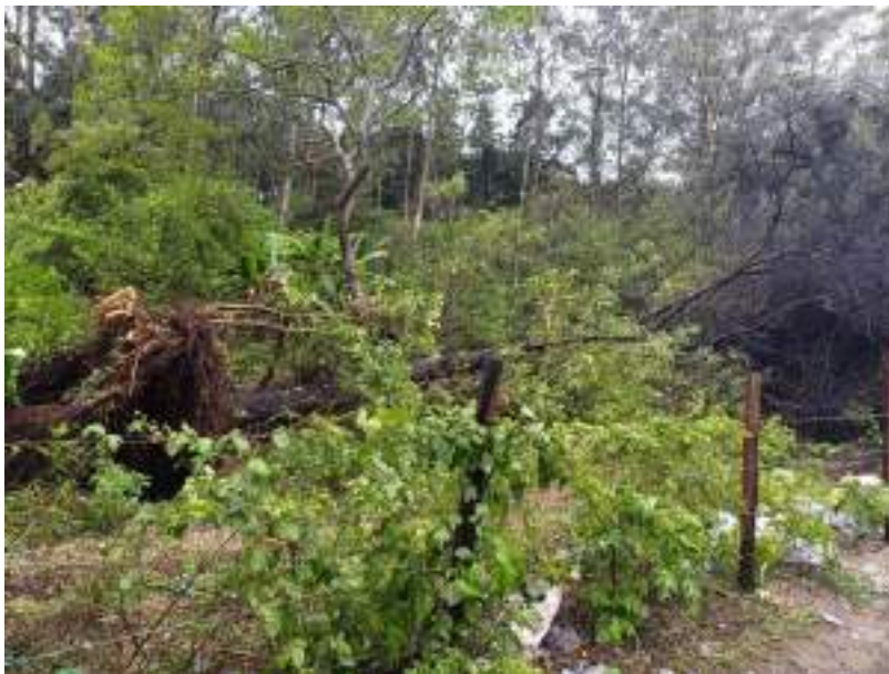
Fotos 1: reparación de cercos por árboles derribados por fuertes lluvias.

Se realizaron labores de mantenimiento de 10 kilómetros de brechas corta fuego, con el objetivo de que no se complique su mantenimiento en la época de presupresión.