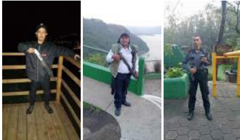
Foto 12, 13 y 14: Personal de vigilancia para prevención de incendios forestales las 24 horas del día.

5.8 Otorgar la cooperación técnica y financiera a la Fundación Defensores de la Naturaleza necesite, siempre que se encuentre dentro de sus posibilidades para el desarrollo dentro del Parque Nacional Naciones Unidas de proyectos de Conservación y Manejo de la Cuenca, considerando que el terreno de este Parque Nacional es parte importante de la Cuenca del Lago de Amatitlán, por lo que se hace necesario realizar actividades de protección y manejo de la misma, incluyendo Educación Ambiental dirigida a estudiantes y población que visita el mismo.