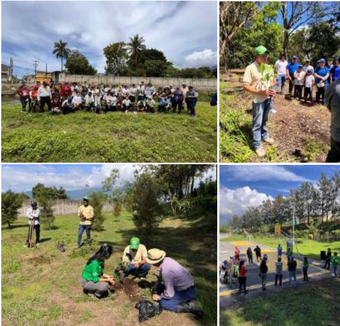
Foto 15, 16, 17 y 18: actividades de educación ambiental descritas.