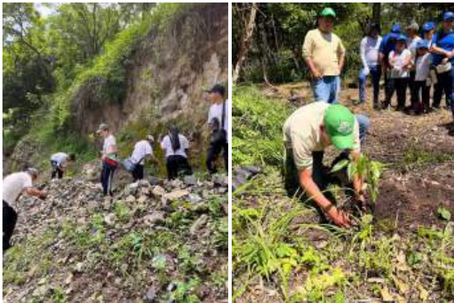
Foto 5 y 6: Personal guardarecursos reforestando y producción de plantas nativas en PNNU

Se establecieron las 5 hectáreas de reforestaciones en el parque, en los lugares que sufrieron incendios forestales.