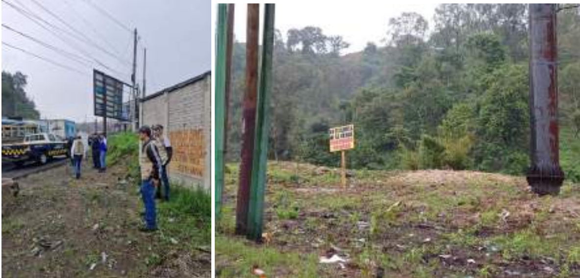
Fotos 2 y 3: ilícitos detectados y participación en inspecciones oculares del MP