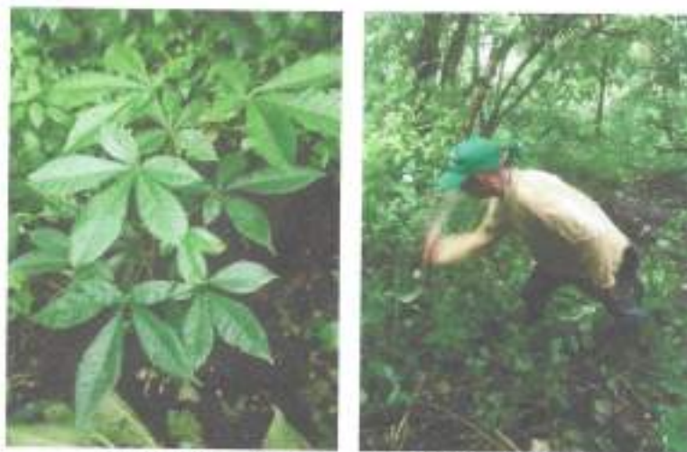
Foto 4 y 5. Área con mantenimiento.

identificada en agosto entre 70 y 80% de árboles que tienen entre 1 a 3 años de haberse establecido.