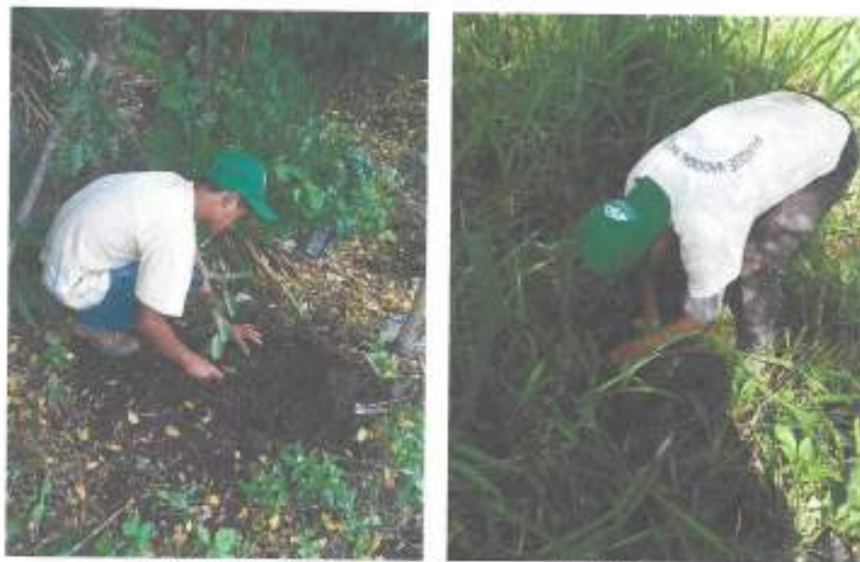
Foto 6 y 7. Reforestación agosto 2023.

Las cinco hectáreas fueron establecidas el mes de agosto. El próximo mes se hará el primer mantenimiento.