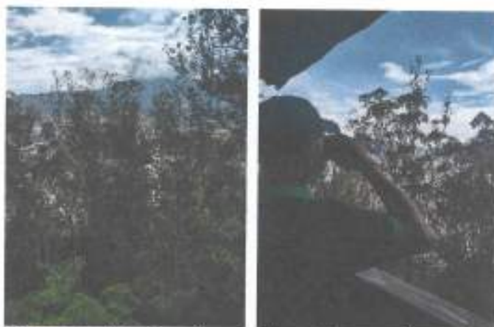
Foto 14 y 15. Monitoreo desde torre de control

forma permanente un elemento de seguridad monitorea desde el mirador principal por cualquier columna de humo.