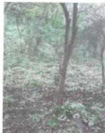
Foto 12 y 13. Área para el establecimiento de estructuras de conservación de suelos.