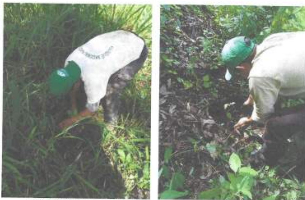
Foto 8 y 9. Mantenimiento en regeneración natural.

Este proceso inició en agosto, y fue finalizado en las primeras semanas de septiembre con tres (3) hectáreas de manejo y mantenimiento donde existe regeneración natural, enriqueciendo con especies atrayentes de fauna y polinizadores.