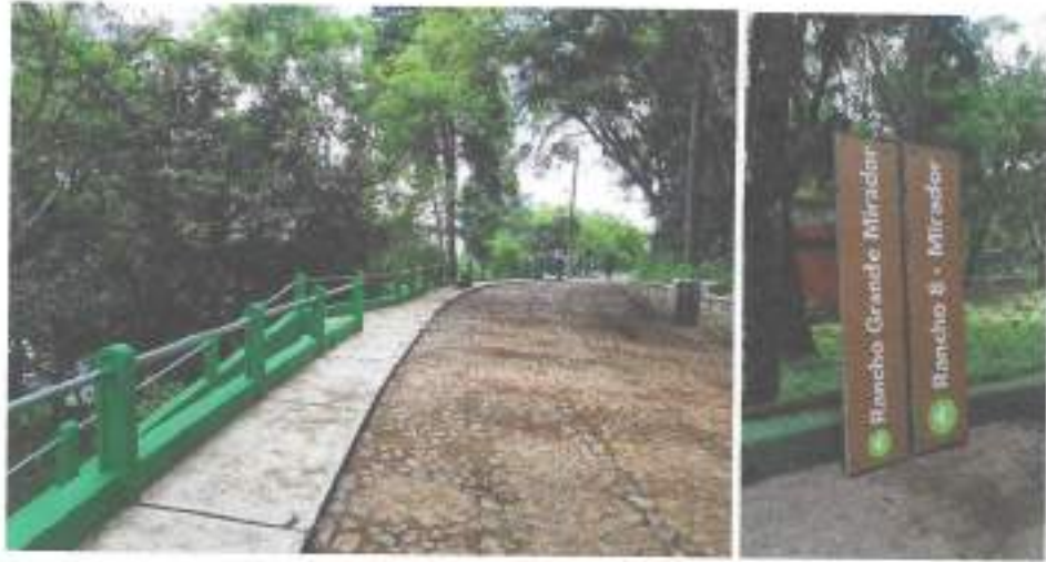
Fotos de mantenimientos descritos anteriormente.