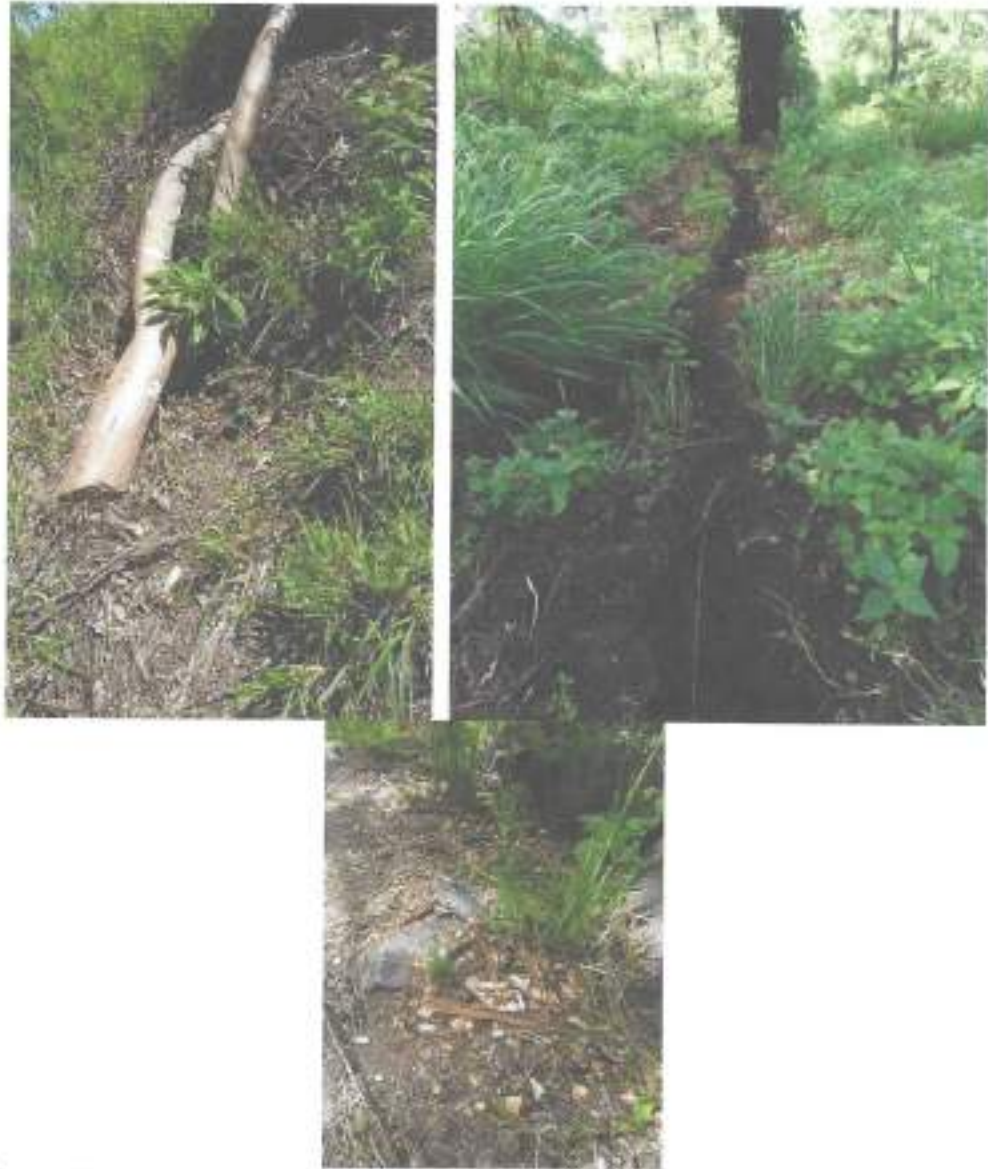
Foto 1, 2 y 3. Trozas taladas de eucalipto, ruta de traslado de trozas y evidencia de preparación de leña.