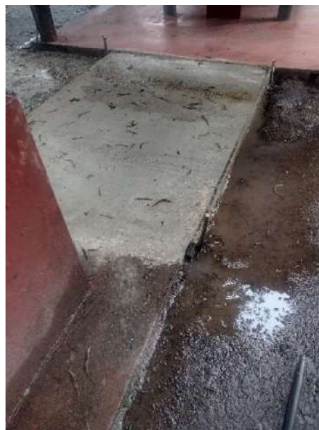
Foto 17 y 18 Mesa para uso de visitantes y paso de concreto entre rancho y churrasquera.