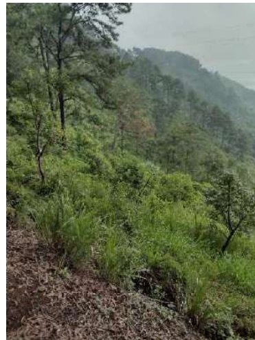
Foto 13 y 14 Área para el establecimiento de estructuras de conservación de suelos.