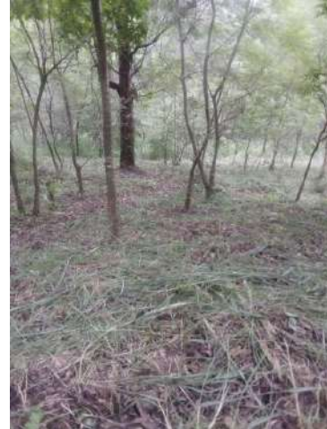
Fotos 5 y 6 Áreas con mantenimiento.