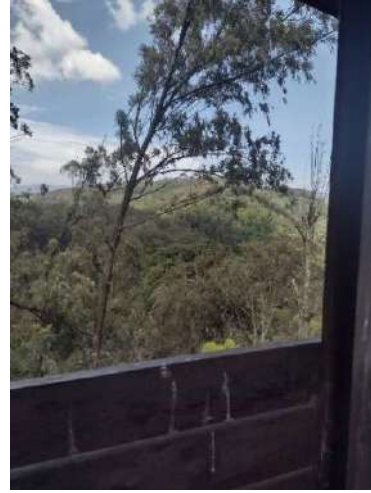
Foto 15 y 16 Monitoreo por medio de la torre de control.

5.8 Otorgar la cooperación técnica y financiera a la Fundación Defensores de la Naturaleza necesite, siempre que se encuentre dentro de sus posibilidades para el desarrollo dentro del Parque Nacional Naciones Unidas de proyectos de Conservación y Manejo de la Cuenca, considerando que el terreno de este Parque Nacional es parte importante de la Cuenca del Lago de Amatitlan, por lo que se hace necesario realizar actividades de protección y manejo de la misma, incluyendo Educación Ambiental dirigida a estudiantes y población que visita el mismo.