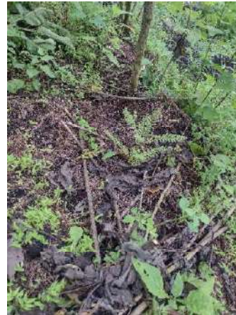
Foto 9 y 10 Plantas de regeneración natural.