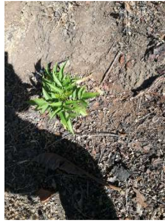
Foto 7 y 8 Estado actual de la planta reforestada en 2022.