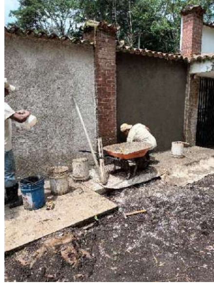
Foto 19 y 20 Limpieza de templos y reparación de paredes de oficinas.