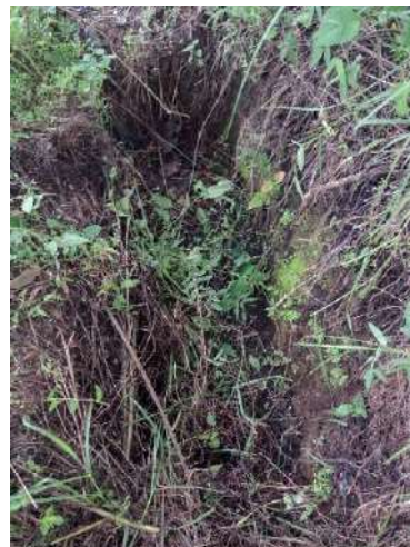
Foto 11 y 12 Estado actual de las estructuras de conservación de suelos.