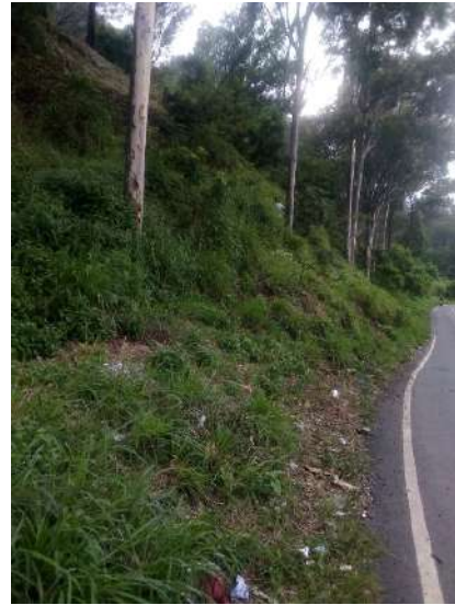
Foto 1 y 2 Estado actual de las brechas de protección.