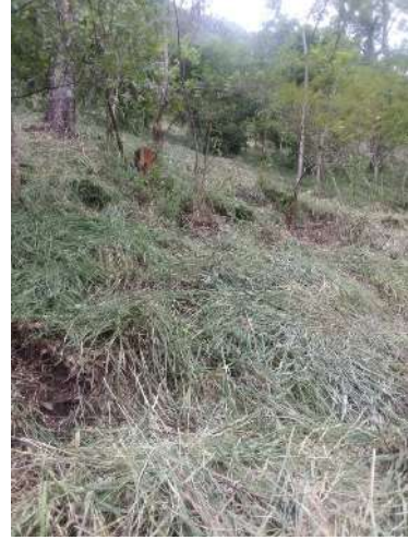
Foto 3 y 4 Chapeo de las áreas reforestadas.