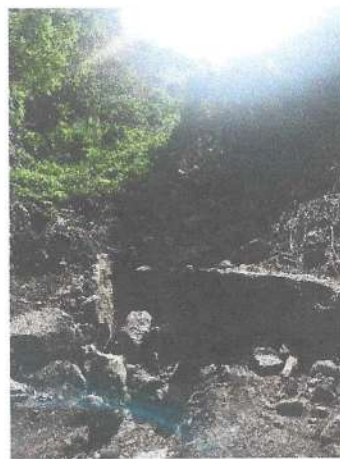
Foto 17 y 18. Chapeo de áreas verdes de deslave en límites de PNUU.