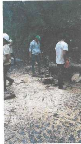
Foto 1 y 2. Reparación de cercos y palos caídos dentro árboles dentro de plaza.