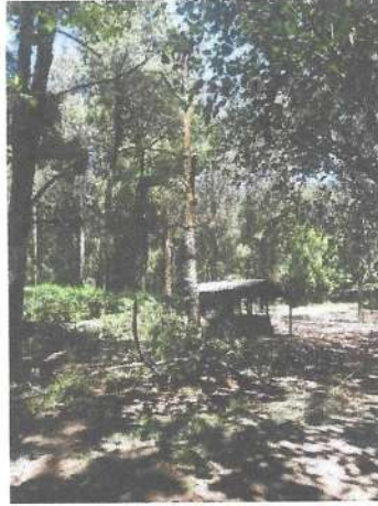
Foto 19 y 20 Colocación de talanquera en ingreso a PNNU y desrame de árboles en peligro a visitantes e infraestructura.