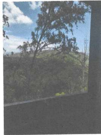
Foto 13 y 14. Control de seguridad por medio de la torre de control.

5.8 Otorgar la cooperación técnica y financiera a la Fundación Defensores de la Naturaleza necesite, siempre que se encuentre dentro de sus posibilidades para el desarrollo dentro del Parque Nacional Naciones Unidas de proyectos de Conservación y Manejo de la Cuenca, considerando que el terreno de este Parque Nacional es parte importante de la Cuenca del Lago de Amatitlan, por lo que se hace necesario realizar actividades de protección y manejo de la misma, incluyendo Educación Ambiental dirigida a estudiantes y población que visita el mismo.