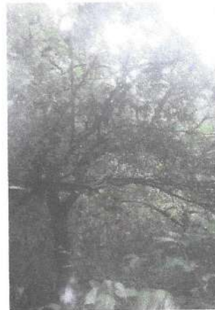
Foto 7 y 8, Área para el establecimiento de regeneración natural 2023.