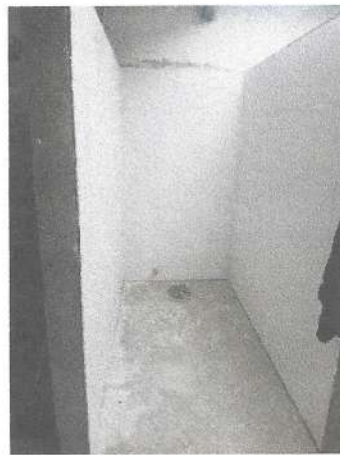
Foto 15 y 16. Reparación de pérgolas y continuación de remodelación de vestidores de personal de PNUU.