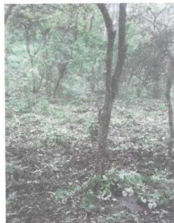
Foto 11 y 12. Área para el establecimiento de estructuras de conservación de suelos.