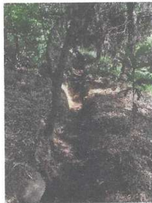
Foto 9 y 10. Estado actual de las acequias con mantenimiento.