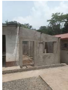
Foto 16 y 17, Construcción de vestidores de personal de PNUU.