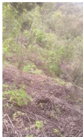
Foto 3 y 4, Replantes en áreas reforestadas.