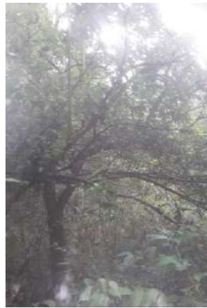
Foto 7 y 8, Área para el establecimiento de regeneración natural 2023.