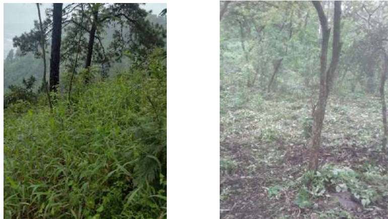
Foto 11 y 12 Área para el establecimiento de acequias 2023.

Para el establecimiento de las 2 hectáreas propuestas para el año 2023, se estarán realizando en el mes de noviembre, ya cuando la temporada de lluvias termine y las condiciones del suelo sean óptimas para la perforación de la zanja y así evitar que el suelo que sale de la perforación se erosione por las lluvias. Las dimensiones se continuarán con las mismas que son de 0.60m de ancho por 0.40m de profundidad.