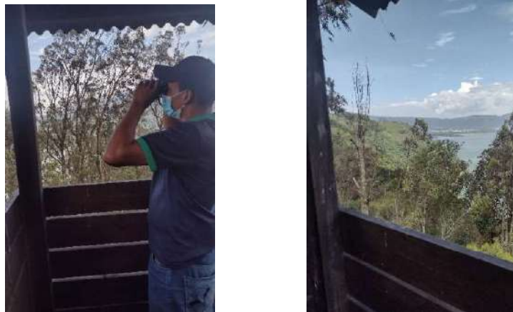
Foto 13 y14, Monitoreo por medio de la torre de control.

La vigilancia se continúa debido a que la temporada de lluvias no se ha establecido en su totalidad, se mantiene a partir de las 13:00 horas todos los días, así también la utilizan los guardias de seguridad, para mantener la seguridad de los visitantes.