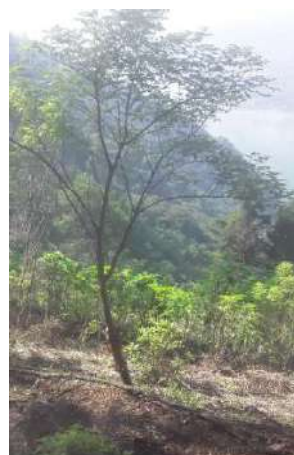
Foto 5 y 6, Área para establecimiento reforestación 2023.