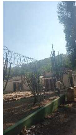
Foto14 y 15, Instalación de alambre razor perimetral, para seguridad de oficinas.