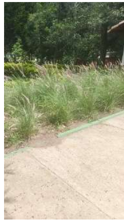
Foto 18 y 19, Mantenimiento de jardines.