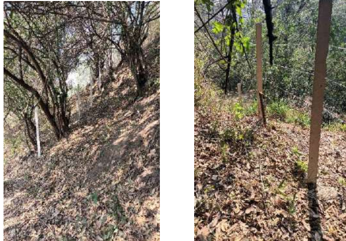
Foto 1 y 2, Verificación de cercos

Las brechas de protección continúan en buen estado, por lo que no se les realizará mantenimiento hasta iniciar la nueva temporada de incendios, que inicia en noviembre.