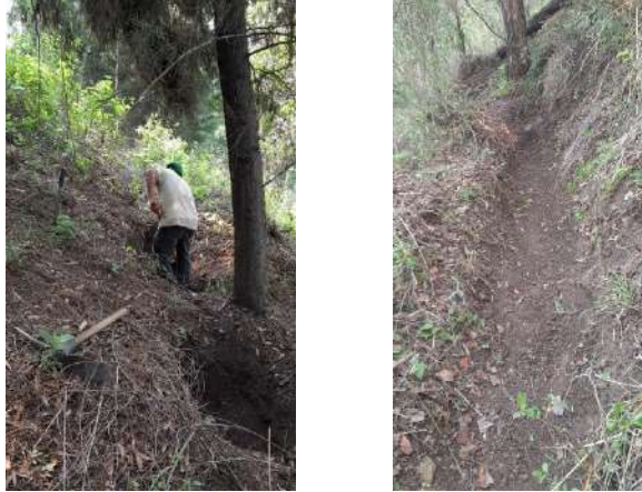
Foto 9 y 10, Mantenimiento de acequias.