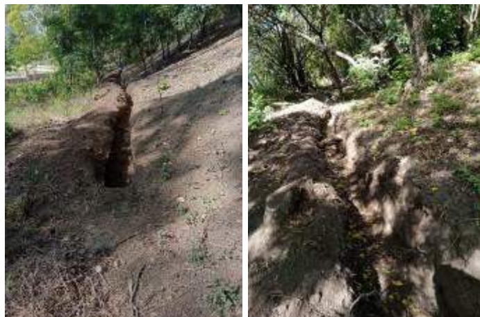
Foto 11 y 12: 2 hectáreas implementadas con nuevas acequias reduciendo erosión en brechas cortafuegos. (fotografías de diciembre 2023)