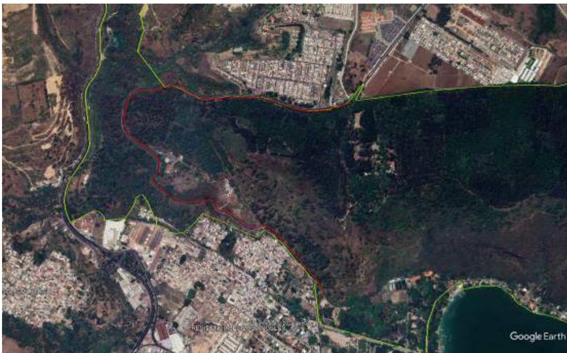
Mapa 2: Ubicación y avances en reparación y reposición de cercos para delimitación de PNU.

Además, se terminó de colocar 2.9 kilómetros de cerco para reducir el acceso de leñadores a las áreas más vulnerables