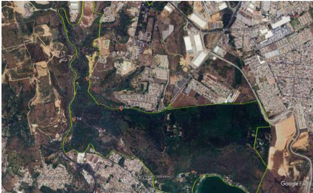
Mapa 1: Ubicación de incendios controlados durante marzo (6.5 ha)

Además, se terminó de colocar 2.9 kilómetros de cerco para reducir el acceso de leñadores a las áreas más vulnerables