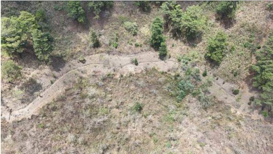
Foto 11: Estado actual de las acequias con mantenimiento. (fotografías de marzo 2024)

Este proceso se iniciará en mayo con las primeras lluvias, para que el suelo se encuentre húmedo y arable.