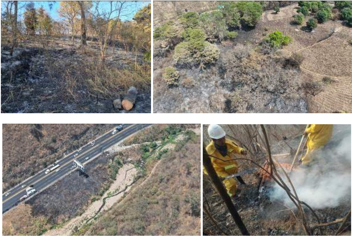
Fotos 1, 2, 3 y 4 : incendios forestales registrados y controlados durante marzo.