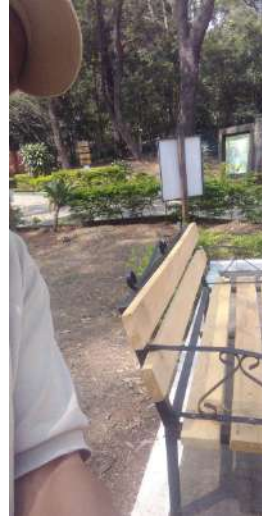
Foto 19 y 20. Reparación de banquetas y bancas de Plaza Antigua.