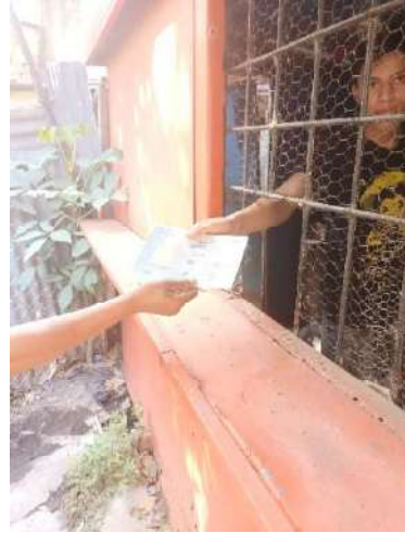
Foto 2 y 3. Campaña de concientización, para prevenir incendios forestales.