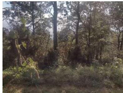
Foto 5 y 6. Área para reforestar 5 hectáreas en 2023.