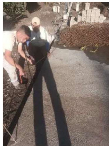
Foto 15 y 16. Construcción de mesas de madera y muro perimetral de oficinas.