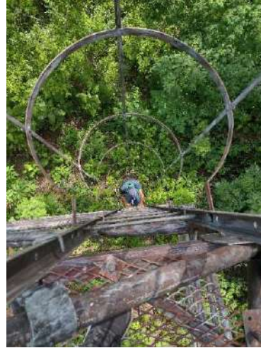
Foto 13 y 14. Monitoreo por medio de la torre de control.

5.8 Otorgar la cooperación técnica y financiera a la Fundación Defensores de la Naturaleza necesite, siempre que se encuentre dentro de sus posibilidades para el desarrollo dentro del Parque Nacional Naciones Unidas de proyectos de Conservación y Manejo de la Cuenca, considerando que el terreno de este Parque Nacional es parte importante de la Cuenca del Lago de Amatitlan, por lo que se hace necesario realizar actividades de protección y manejo de la misma, incluyendo Educación Ambiental dirigida a estudiantes y población que visita el mismo.