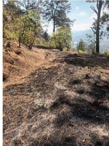
Foto 1 y 2. Construcción de líneas negras, para protección de incendios.