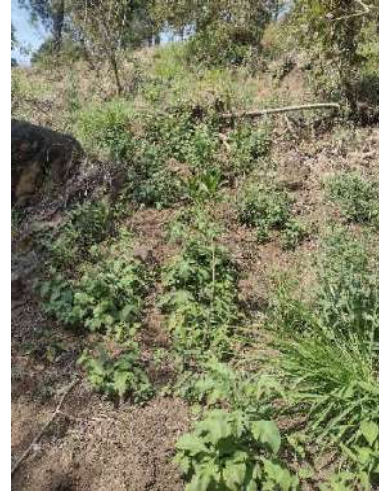
Foto 11 y 12. Área para el establecimiento de estructuras de conservación de suelos.