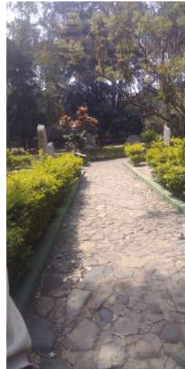
Foto 21 y 22. Mantenimiento de jardines de PNUU.