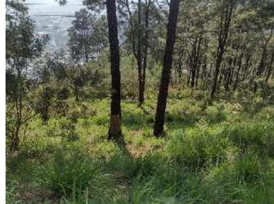
Foto 7 y 8. Área para establecimiento de 5 hectáreas de regeneración natural.