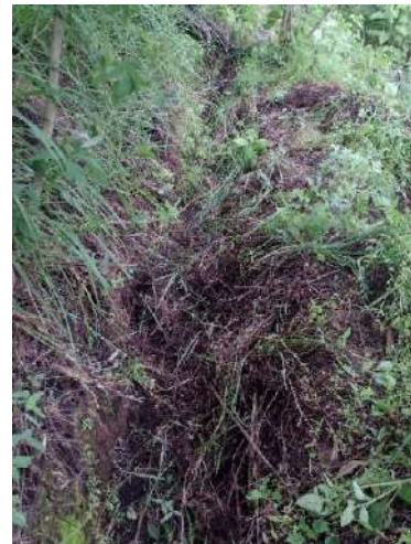
Foto 9 y 10. Estado actual de estructuras de conservación de suelos.