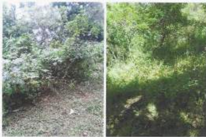
Foto 9 y 10. manejo de regeneración natural (repique o liberación de brotes) (fotografías de octubre y agosto).

Este proceso inició en agosto, y culminó la primera semana de octubre con un total de 5 hectáreas de manejo y mantenimiento donde existe regeneración natural, enriqueciendo con especies atrayentes de fauna y polinizadores.