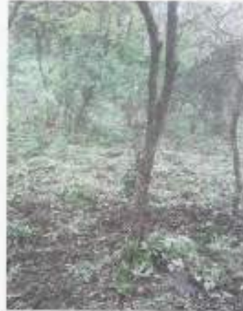
Foto 13 y 14. Área para el establecimiento de estructuras de conservación de suelos.