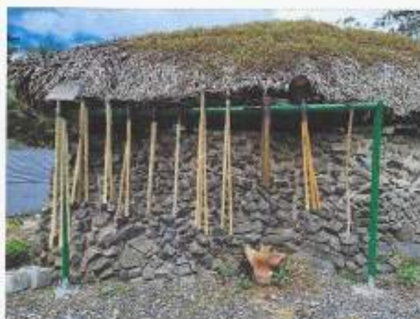
Foto 15, 16, 17, 18 y 19. Mantenimientos descritos anteriormente.