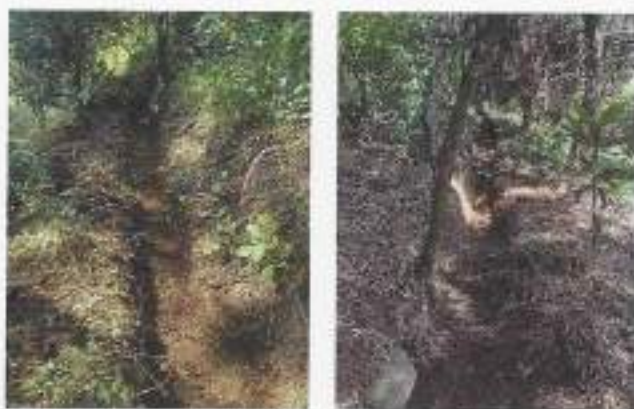
Foto 11 y 12. Estado actual de las acequias con mantenimiento (fotografías de meses anteriores).

Durante el mes no se realizó ningún trabajo a las estructuras de conservación de suelos, debido a que se inició con el mantenimiento de reforestaciones aprovechando la temporada de lluvias. El mantenimiento se iniciará en diciembre, ya cuando las lluvias han disminuido y las condiciones del suelo son más favorables para realizar dicha actividad, posterior al mantenimiento de brechas corta-fuegos.