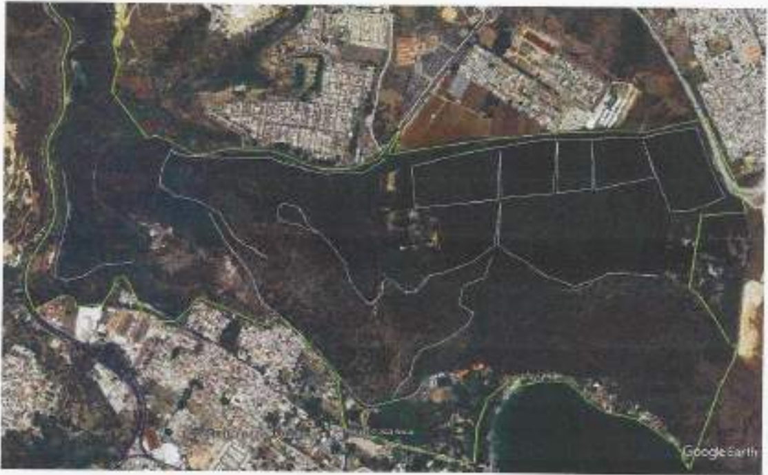
Mapa de ubicación de 11.5 km de brechas corta-fuegos trabajadas