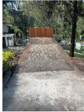
Foto 15 y 16, Aplicación de pintura y reparación de puente.