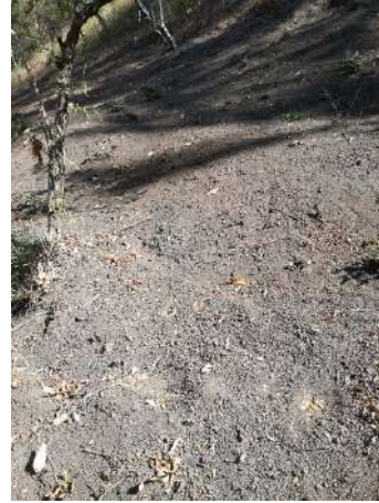
Foto 1 y 2, Brechas de protección con mantenimiento, a suelo mineral.