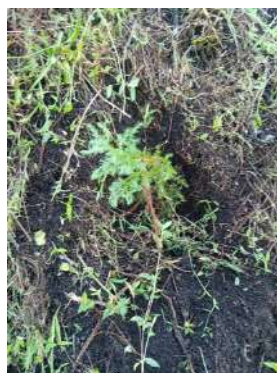
Foto 5 y 6, Áreas de regeneración natural.