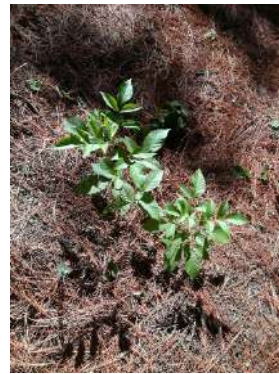
Foto 4 y 5, Estado actual de plantas reforestadas.