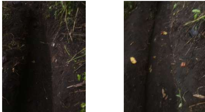
Foto 9 y 10, Establecimiento de estructuras de conservación de suelos, (acequias).

En el mes se establecieron las 2 hectáreas para el año 2022, en el área propuesta, con 14 jornales por 8 días, para completar el resultado, con una tarea diaria de 20 metros lineales de apertura de zanja y chapeo de barrera viva, completando el 100% del resultado.