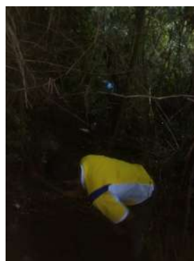
Foto 7 y 8, Mantenimiento de estructuras de conservación de suelos.