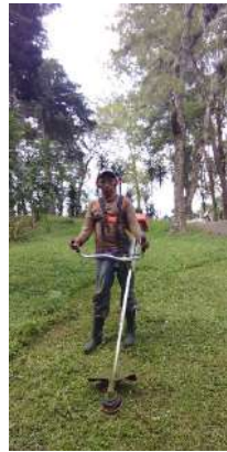
Foto 17 y 18, Reparación de paredes de Plaza Antigua y chapeo de áreas verdes.