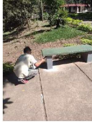
Foto 13 y 14, Reparación de cernido de búcaro de Plaza Antigua y pintado de bancas.