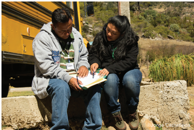
Visita y evaluación de campo

Dicho formato se puede modificar o adaptar al área. Éste incluye instrucciones de llenado para cada sección incluyendo cuadros y gráficos.