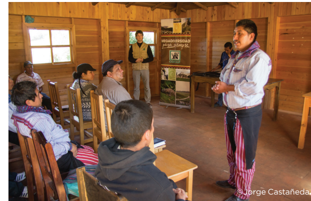
Entrevista con encargados

La oferta turística de un destino se conforma de tres partes esenciales: