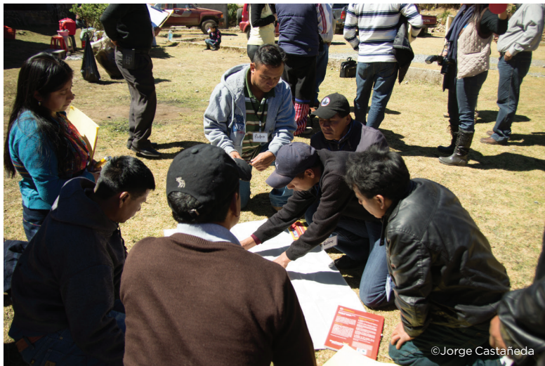
Evaluación de área

Cuando un área es deficiente en la parte de estructura o de administración, esto se reflejará en la gráfica como áreas en las que se debe poner especial atención en planificación e inversión. El área puede tener potencial turístico siempre y cuando se tengan los recursos para invertir en estos dos aspectos. Sin embargo, si el área presentara baja calificación en la parte de atractivos y actividades se considera que el área NO tiene potencial turístico (ya que son elementos que no se pueden crear como en el caso de la estructura por ejemplo).