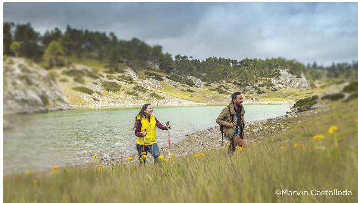
Recorrido del área