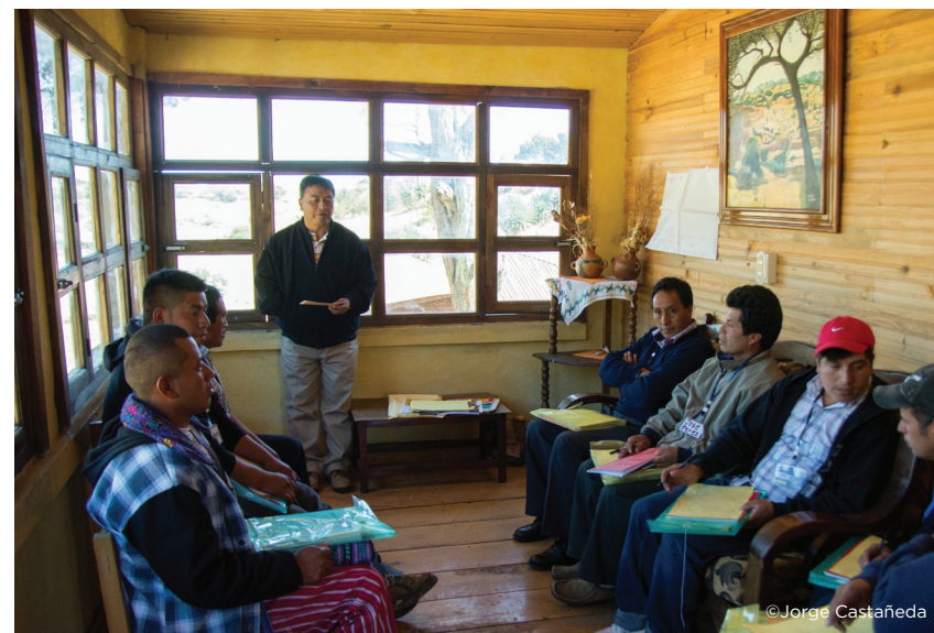
Entrevista a personal administrativo

Llenar el cuadro de aspectos administrativos en base a la entrevista a personal administrativo y a la evaluación de campo. Tanto la ficha de entrevista como este formato pueden ser adaptados según el área (agregar secciones o quitar elementos que no aplican: si alguno de los elementos no aplica ni se considera algo potencial se debe eliminar de la lista para evitar alterar la calificación real. Si se elimina o agrega algún elemento de esta lista también se debe agregar o eliminar del cuadro de resumen No.11).