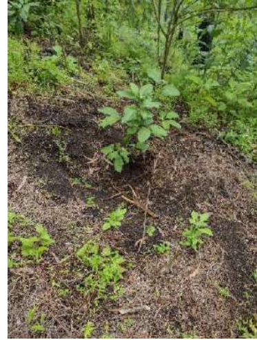
Foto 5 y 6, Planta reforestada