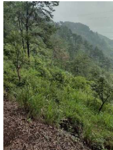
Foto 7 y 8. Posible área para reforestar.