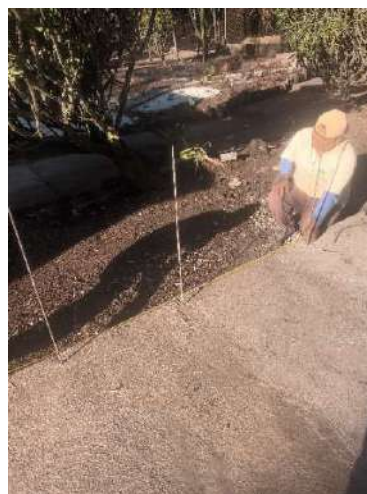
Foto 17 y 18. Reparación de banquetas y construcción de puerta de pozo de infiltración.