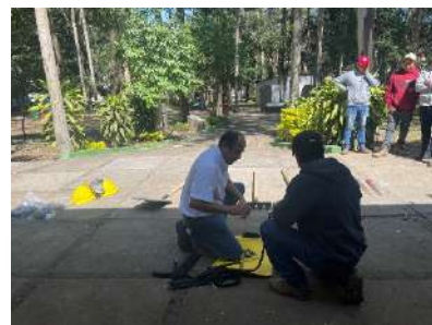
Foto 3 y 4. Capacitación a personal, con incendios forestales.