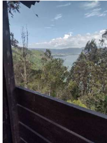
Foto 15 y 16. Monitoreo por medio de la torre de control.

5.8 Otorgar la cooperación técnica y financiera a la Fundación Defensores de la Naturaleza necesite, siempre que se encuentre dentro de sus posibilidades para el desarrollo dentro del Parque Nacional Naciones Unidas de proyectos de Conservación y Manejo de la Cuenca, considerando que el terreno de este Parque Nacional es parte importante de la Cuenca del Lago de Amatitlan, por lo que se hace necesario realizar actividades de protección y manejo de la misma, incluyendo Educación Ambiental dirigida a estudiantes y población que visita el mismo.