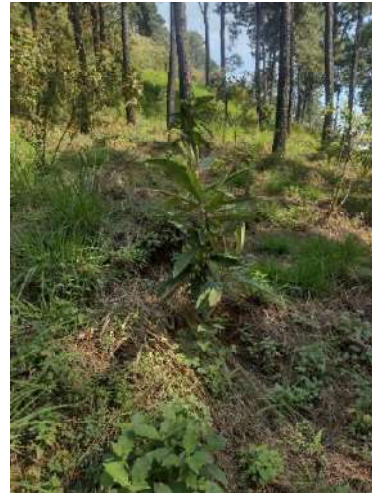
Foto 9 y 10. Posibles áreas para establecer regeneración natural.