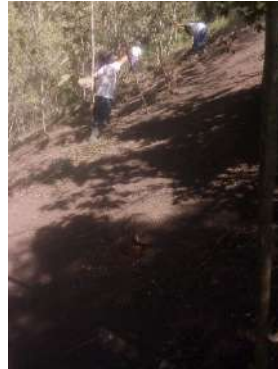
Foto 1 y 2, Mantenimiento de líneas de control o brechas corta fuego.