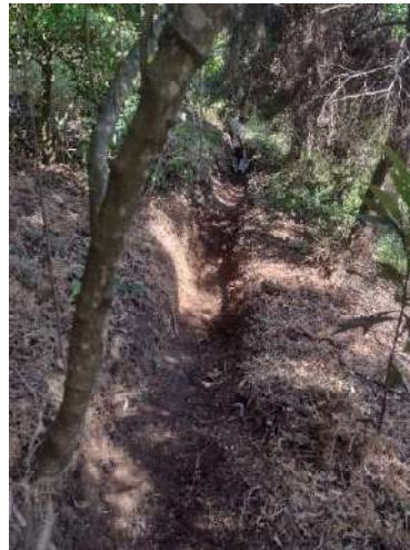
Foto 13 y 14. Estado actual de las estructuras de conservación de suelos.