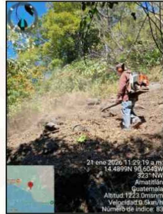
FIGURAS 2-11. Trabajos de mantenimiento de rondas y fajas corta fuegos durante el mes de enero 2026