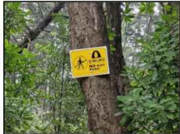
FIGURAS 12-15. Patrullajes realizados durante el mes de enero 2026.