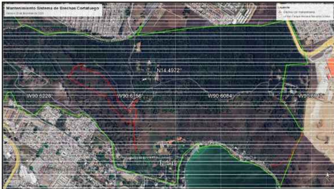
FIGURA 1. Mapa de ubicación de rondas y fajas corta fuego trabajadas en el mes de enero 2026.