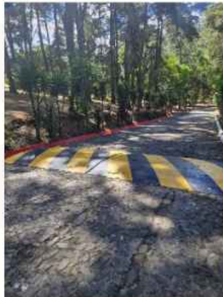
FIGURAS 26-29. Trabajos de mantenimiento varios durante el mes. Guatemala, febrero del 2026